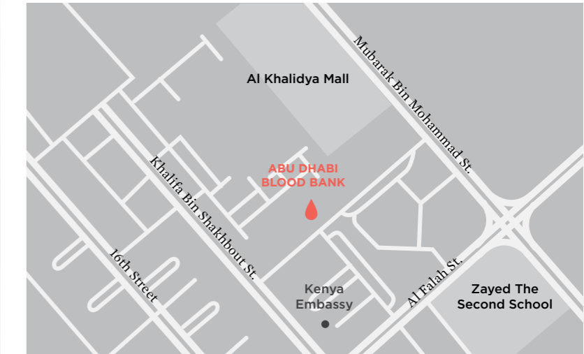
Abu Dhabi Blood Bank in Khalidiya